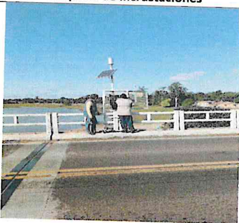
Descarga de información: