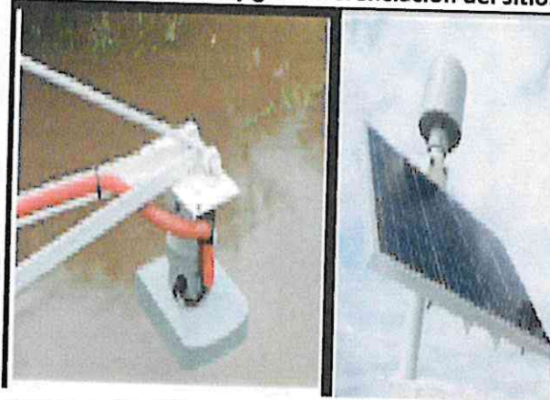
Sensor de Nivel Tipo Radar, Pluviómetro y panel solar

MISIÓN: Normar las actividades relacionadas a la aviación civil y prestar servicios para satisfacer a las partes interesadas