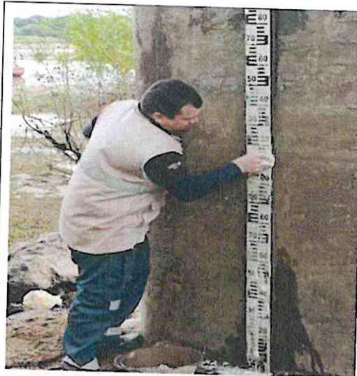
Limpieza de incrustaciones